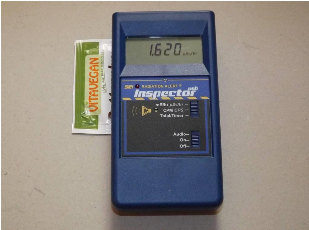
Abb.2: Messung der Radioaktivität (zusammen mit dem Hintergrund), Fenster des Geigerzählers befindet sich auf der Unterseite, das Gerät zeigt hohe Werte (relativ für Lebensmittel) an

Auf der Packung findet man auch eine ordentliche Inhaltsangabe: „20g Inhalt, Zutaten Backtriebmittel: Kaliumcarbonat“. Betrachtet man das näher, dann hat die Radioaktivität, die man erkennen kann, sobald man den Geigerzähler auf die Packung legt, ihre ganz normale Richtigkeit. Das wäre bei einem anderen Hersteller auch ganz genau dasselbe, ob Bio, vegan, lactose- oder glutenfrei, solange es echte Pottasche ist, die drin ist. Selbst wenn man, als ein auf wirklich reine Zutaten bedachter Bäcker/in, 99% reines Kaliumcarbonat in der Apotheke kaufen würde, auch dann bekäme man dasselbe Ergebnis. Denn die deutlich spürbare Radioaktivität stammt aus dem Kaliumcarbonat.