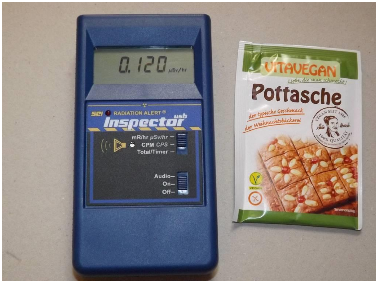
Abb.1: Geigerzähler und Backtriebmittel „Pottasche“ nebeneinander (Hintergrundmessung)

Sicherlich wäre es für so manche/n Weihnachtsbäcker/in, der auf gesunde Ernährung besonders viel Wert legt, ein völlig schockierendes Erlebnis, wenn man ihm so ein Päckchen Pottasche (wie z.B. von der Firma Biovegan GmbH) vor seinen Augen unter einen guten Geigerzähler legt, und das Gerät dann wie wild anfängt zu ticken und dabei etwa das Zehnfache des Hintergrundwertes anzeigt. Da kommt unter Umständen sogar schnell der Gedanke auf, ob da nicht ein fremder Geheimdienst es auf einen abgesehen hat oder irgendwelche abgrundtief böse Menschen versuchen könnten, den Hersteller zu erpressen oder üble terroristische Verbrechen zu begehen. Nichts von dem ist aber richtig.